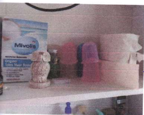
— sitne potreštine za salon 100€