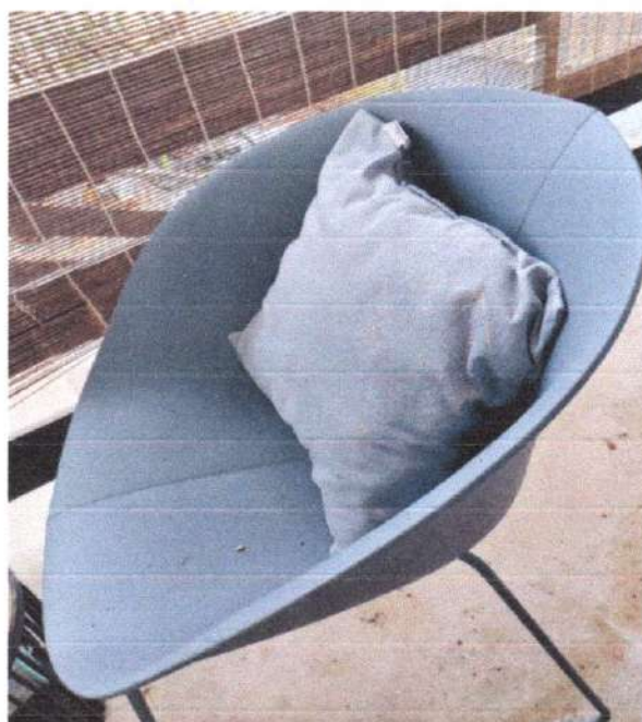
- stolica 80€