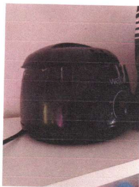
uređaj za dep 50€