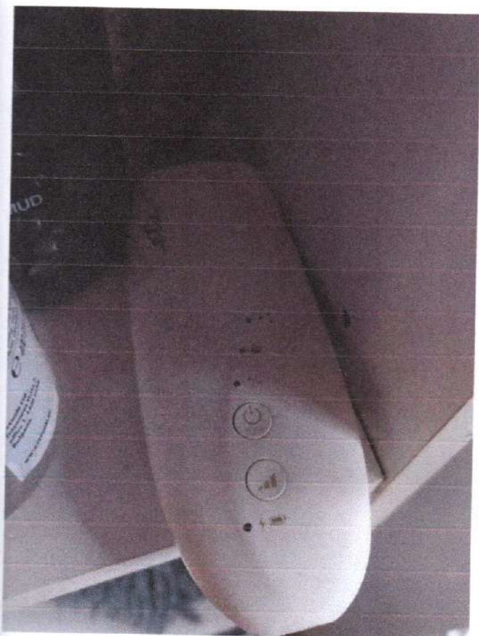
1 uređaj za uklanjanje lica 50€