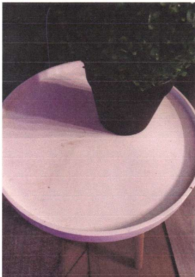
- stolić vrijednost 20€