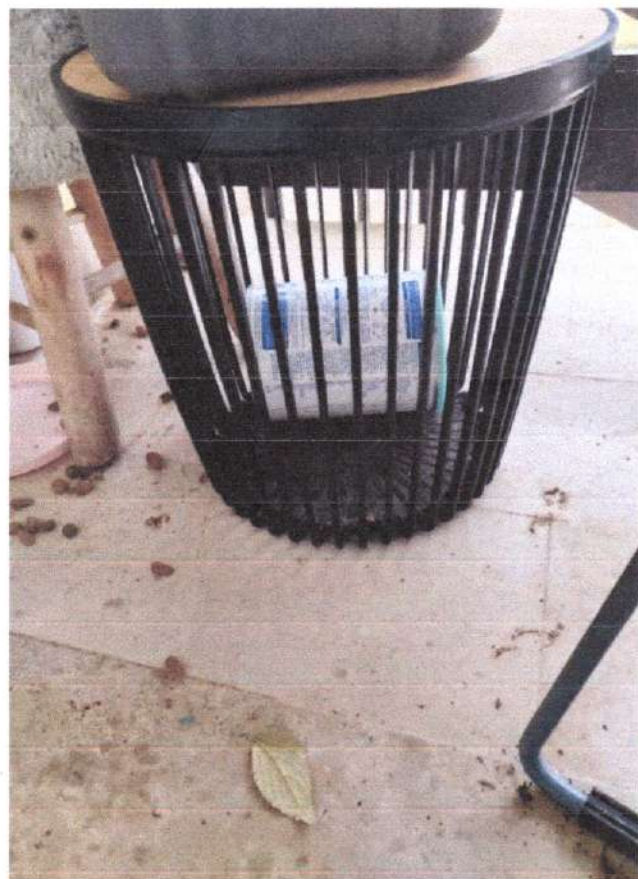
Pomoćni stolić - 20€